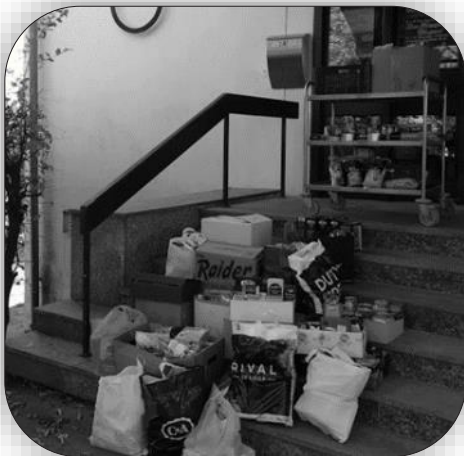
Text und Foto: Annette Schulz

Zum Erntedankfest haben wir haltbare Gaben für die Tafel Horn Bad Meinberg gesammelt. Aus jedem Ortsteil unserer Gemeinde und von der katholischen Gemeinde in Feldrom und Kempen brachten die Menschen Kakao, Kaffee, Nudeln, Mehl, Kekse, Zucker und jede Menge Nussnougatbrotaufstrich. Die Mitarbeiter der Tafel waren ganz beeindruckt. Unsere Gaben konnten auf beide Ausgabestellen in Horn und in Bad Meinberg verteilt werden. Laut „Zeugenaussagen“ haben sich viele Bedürftige darüber freut. Wir sagen für die Spendenbereitschaft ganz herzlich Dank!