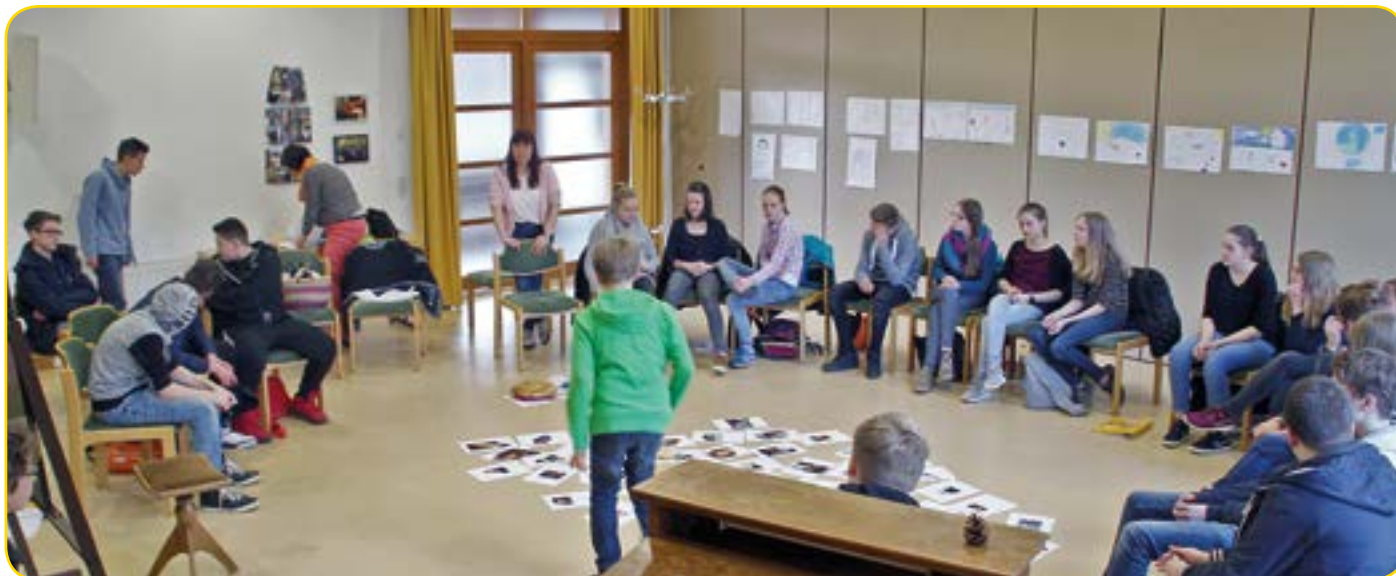
Nach der Arbeit in Gruppen treffen sich alle im Plenum