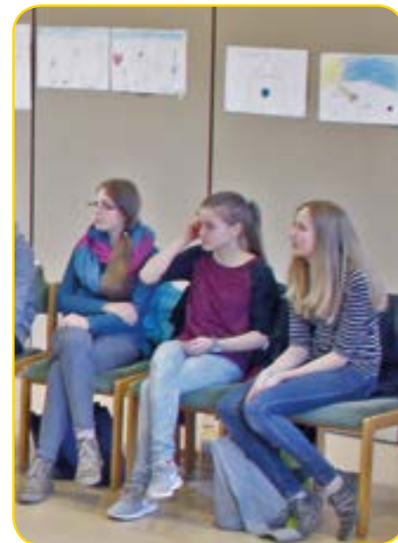
... die Mädchen

Nicko Langlitz: Glaube ist wie das Wasser zum Leben. Jesus Christus ist für mich der eingeborene Sohn Gottes.