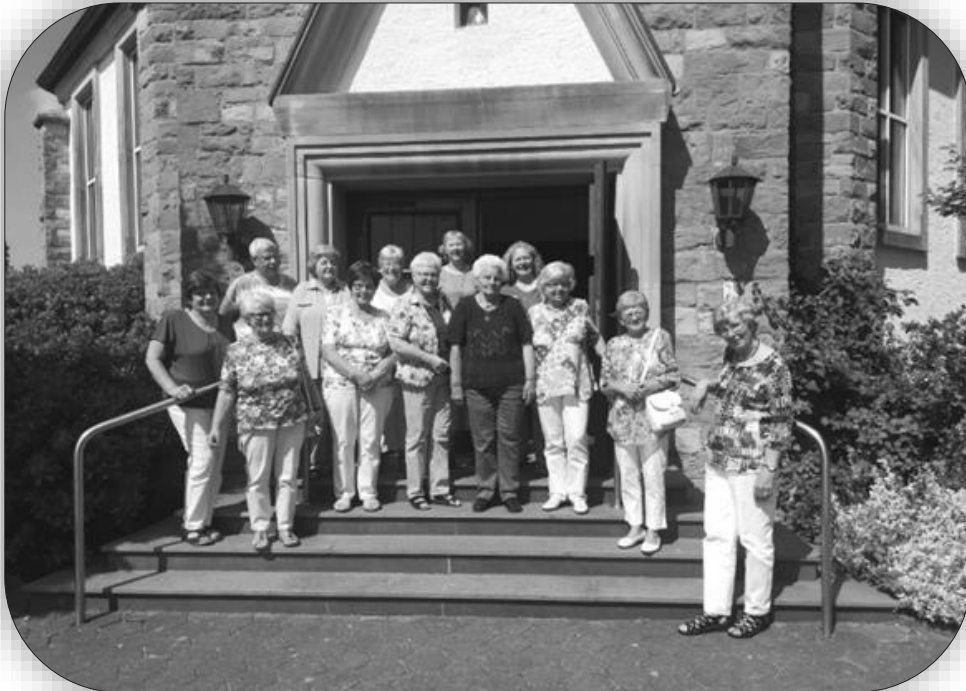
Bericht und Foto: Annette Schulz

Ein Kaffeetrinken in Bad Meinberg rundete den Nachmittag ab. Mit der Vorfreude auf das Wiedersehen nach der Sommerpause ging jede nach Hause.